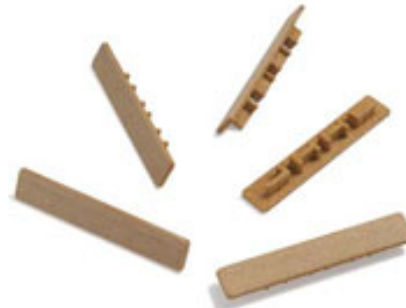
Eindkap Cento Techwood