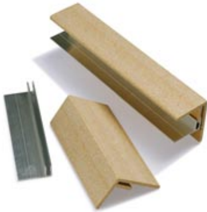
Eindprofiel Cento Techwood

Voor het Cento Techwood vlondersysteem heeft Cento speciale toepassingen ontwikkeld voor de afwerking van het Cento Techwood. Hierdoor krijgt uw Cento Techwood systeem de natuurlijke uitstraling.