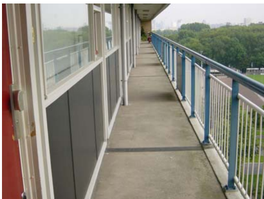
Voor het Opplussen!

De verbinding is zo stevig dat het kleppen en het uit elkaar lopen van de tegels niet meer mogelijk is. Het schuren en kraken van tegels wordt voorkomen zodat er een geluidsarme constructie ontstaat.